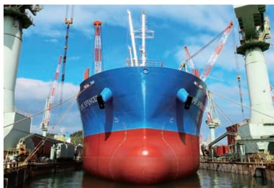
貨物船「CAPE SPENCER」 今治造船株式会社様にて進水時

当社では、加工、物流、船舶保有を総合的に絡めた展開を行わせていただくことにより多様化していく局面に、柔軟に対応できる体制の構築をめざしながら、地域の皆さまの期待に応えてまいります。